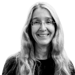
В.о. міністра охорони здоров'я доктор Уляна Супрун