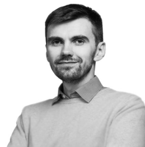
Павло Ковтонюк Заступник міністра охорони здоров'я

Для керівників закладів головним завданням буде реорганізація в некомерційні комунальні підприємства. Це дасть закладу можливість мати значно більше свободи у прийнятті щоденних рішень, мати рахунок закладу в банку,