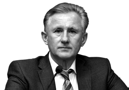
Роман Ілюк Заступник міністра охорони здоров'я

Урядова програма «Доступні ліки» успішно впроваджувалася минулого року. Кожна третя аптека добровільно бере участь у програмі — нині їх 6 744. Програма користується популярністю у пацієнтів: за 8 місяців роботи пацієнти отримали ліки майже за 12 мільйонами рецептів на суму понад 500 млн грн. За час, коли програма набирала обертів і їй почали довіряти, кількість пацієнтів збільшилася у 10 разів, і це наша спільна перемога.